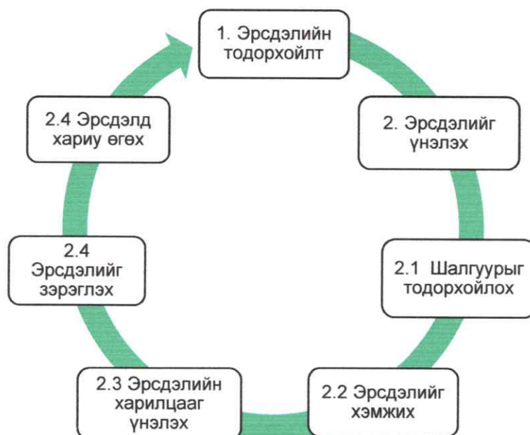
Зураг 1. Эрсдэлийн удирдлагын үйл явц

2.1.Байгууллагын зорилго, зорилтыг хэрэгжүүлэхэд сөрөг нөлөөлөх эрсдэлийг тодорхойлж, тэдгээрийн тохиолдох магадлал ба нөлөөллийг үнэлж, эрсдэлд хариу өгөх, мониторинг хийх зэрэг асуудлуудыг багтаасан олон улсад мөрдөгддөг COSO (Committee of Sponsoring Organizations) загварыг эрсдэлийн үнэлгээнд ашиглана.